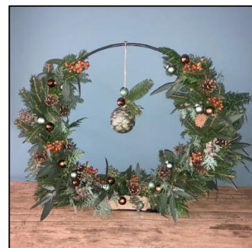
A: 30 cm incl. lampjes