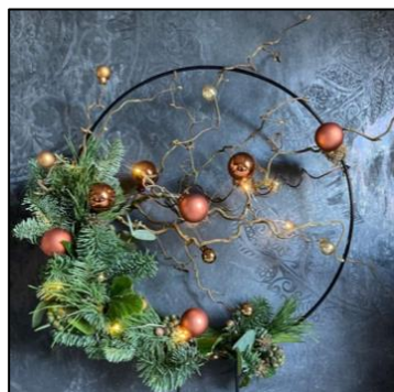
B: 40 cm incl. lampjes