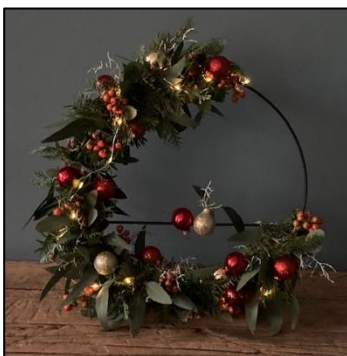
A: 30 cm incl. lampjes