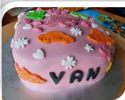
Deze 2 taartjes zijn gemaakt door en met kinderen.